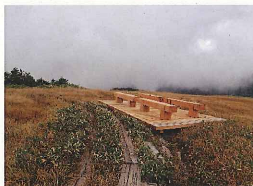
中門岳の見晴の良い場所にテラスを新設しました。