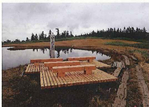
中門池にあるテラスを新しく改修しました。