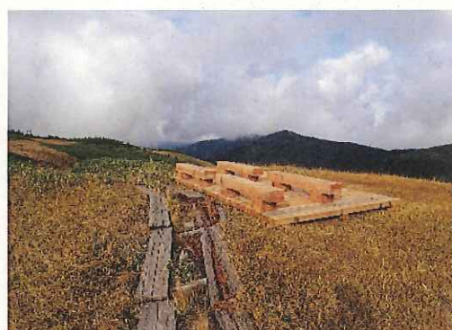
稜線の見晴の良い場所にテラスを新設しました。